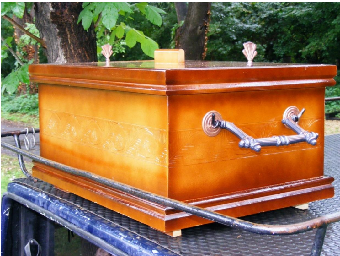
Kosztá József exhumálása a Kerepesi temetőben