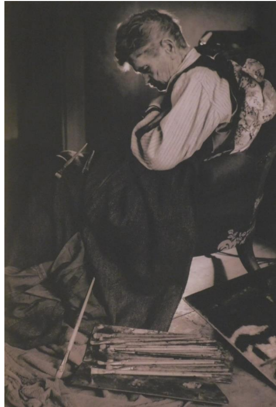
Gink Károly: Koszta József 88 éves, 1949

A múzeum jelenlegi bejáratánál az idős mester portréja köszönti a látogatót, Gink Károly fotóművész fényképe az utolsó, amely Kosztáról készült.