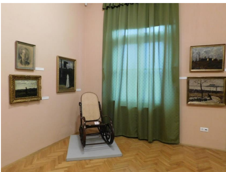
Állandó Koszta-kiállítás a Koszta József Múzeumban